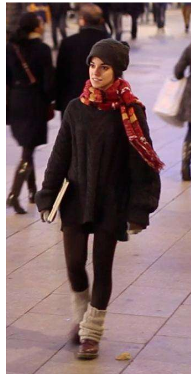
"Canción de Navidad" (hivern 2012)