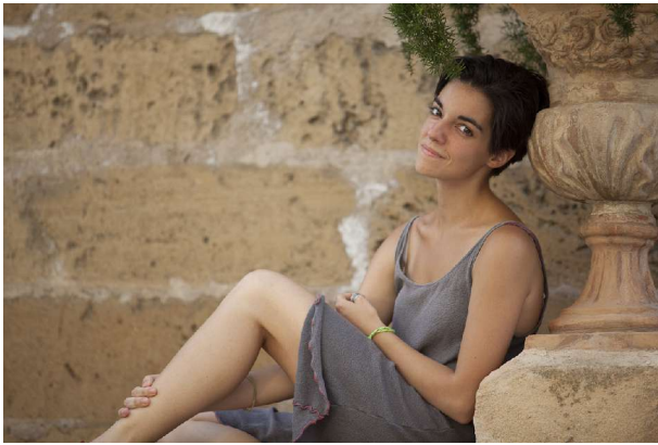
Sessió de fotos estiu 2013 (fotos sup i inf)

El meu aspecte està al servei dels projectes en què treballi. He dut el cabell llarg, curt, amb serrell, sense, etc.